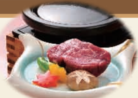
100g石焼き国産フィレステーキ 【お一人様】1,000円