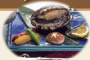
あわび石焼き90g相当 【お一人様】2,000円