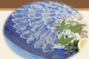
とらふぐ刺し(大皿は1皿4名様から承ります) 【お一人様】2,000円